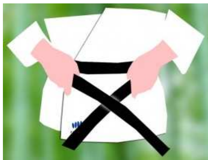
2 – Passe la ceinture devant toi et ramène la devant La ceinture de la main droite est au-dessus