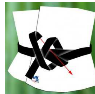
4 – Ferme le nœud