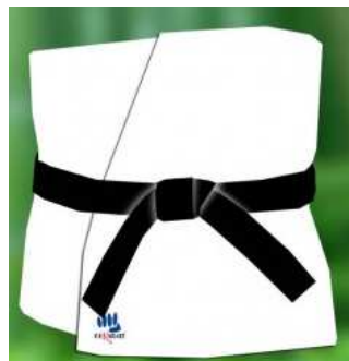
6 – Les deux bouts doivent être de même longueur et le nœud le plus carré possible

Ton professeur s'est exercé – regarde la vidéo - et il est maintenant prêt à aider Kanda !!