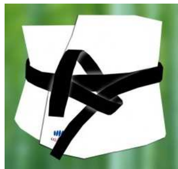
3 – Fais un premier tour